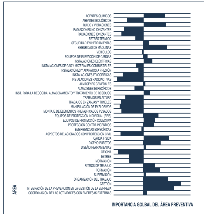
Figura 2. Puntuación media, ponderada para el conjunto de sectores productivos de la Comunidad Valenciana, de las diferentes áreas preventivas. La línea central representa el interés medio manifestado por las personas consultadas sobre necesidad de contar con apoyo tecnológico y de investigación en las áreas consideradas.

En la primera de ellas se ha analizado las necesidades en materia de Prevención de Riesgos Laborales de la Comunidad Valenciana que pueden ser atendidas desde la I+D+I. Para ello se han valorado: